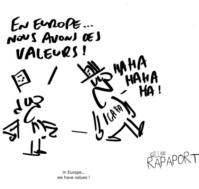
In Europe... we have values!